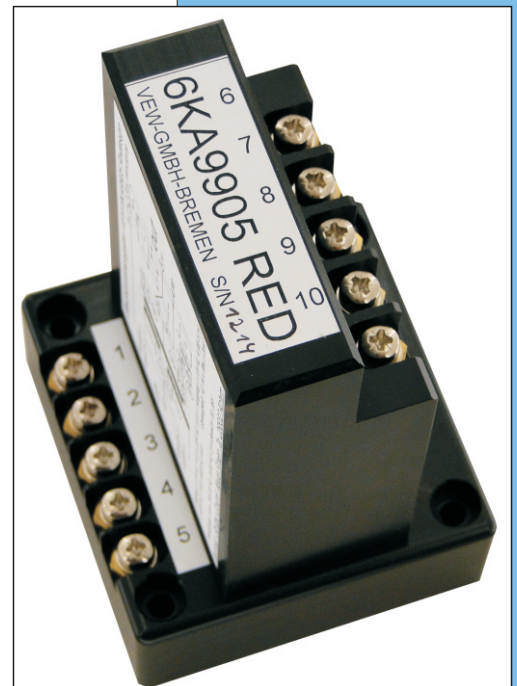
Gleichspannungsmessgeber VEW 6KA9905 Redesign

Die Geräte werden mit einem Einzelprüfprotokoll geliefert.